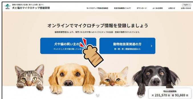
犬と猫のマイクロチップ情報登録サイト トップページ