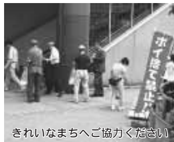
きれいなまちへご協力ください