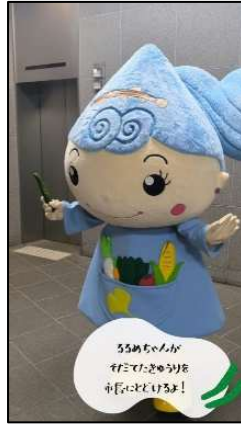
るるめとキュウリ