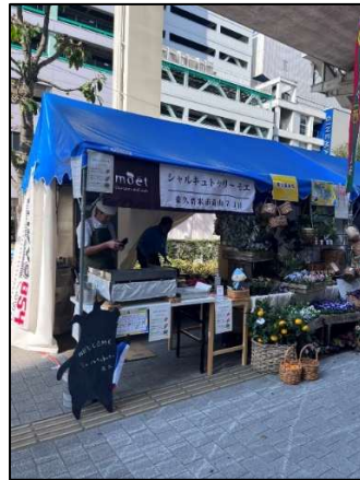
東久留米市ブースの様