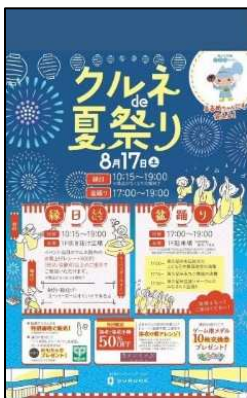
くるね de 夏まつり

今期中では、地元スーパーのイベント、大学の学園祭、幼稚園のハロウィンパーティー、市民プラザで実施されたジャズコンサートなどで協力を得ることができ、事前告知のポスターや、るるめちゃんの写真を投稿することができた。