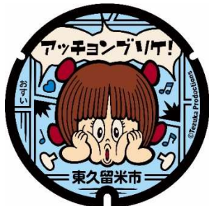
今回制作したデザインマンホール（スパジアムジャポン前）

令和5年度には、東久留米市が実施したデザインマンホール蓋の製作、設置にあわせて、市では協議会にデザイン案を示して、方向性などを部会で検討した。