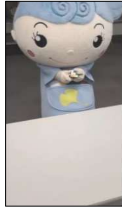
るるめちゃんルービックキューブ