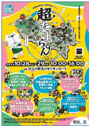
たまらん博チラシ