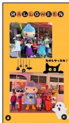
ハロウィンパーティー