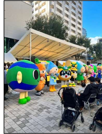
ゆるキャライベント

会場には両日合わせ9万人を超える来場者があり、本市のブース前も絶えず行列ができ、物販については、令和元年に参加した多摩地域の振興イベント「多摩の超文化祭」を大きく上回る売り上げにつながった。