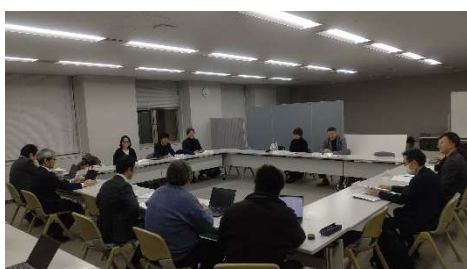
地域産業推進協議会の様子