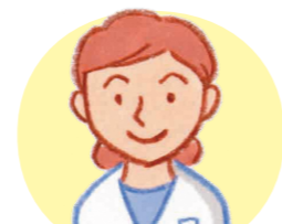
保健師 (または経験のある看護師)