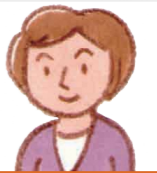
生活支援 コーディネーター

地域で活躍している自主グループや新しいグループの立ち上げ、住民主体サービスの開発の支援やサービスの担い手の発掘・養成を行います。