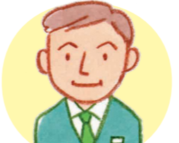
主任 ケアマネジャー