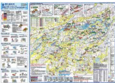
洪水ハザードマップ