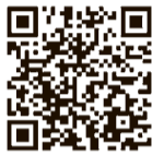
市庁 (安心くるめーる)