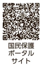
国民保護ポータルサイト

5月18日(水)午前11時ごろ防災行政無線から「これはJアラートの試験です」との試験放送が流れます。 岡環境政策課 042・470・7769