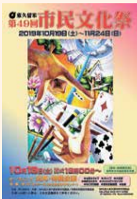
過去の市民文化祭ポスター ※中央のデザイン画を募集します。