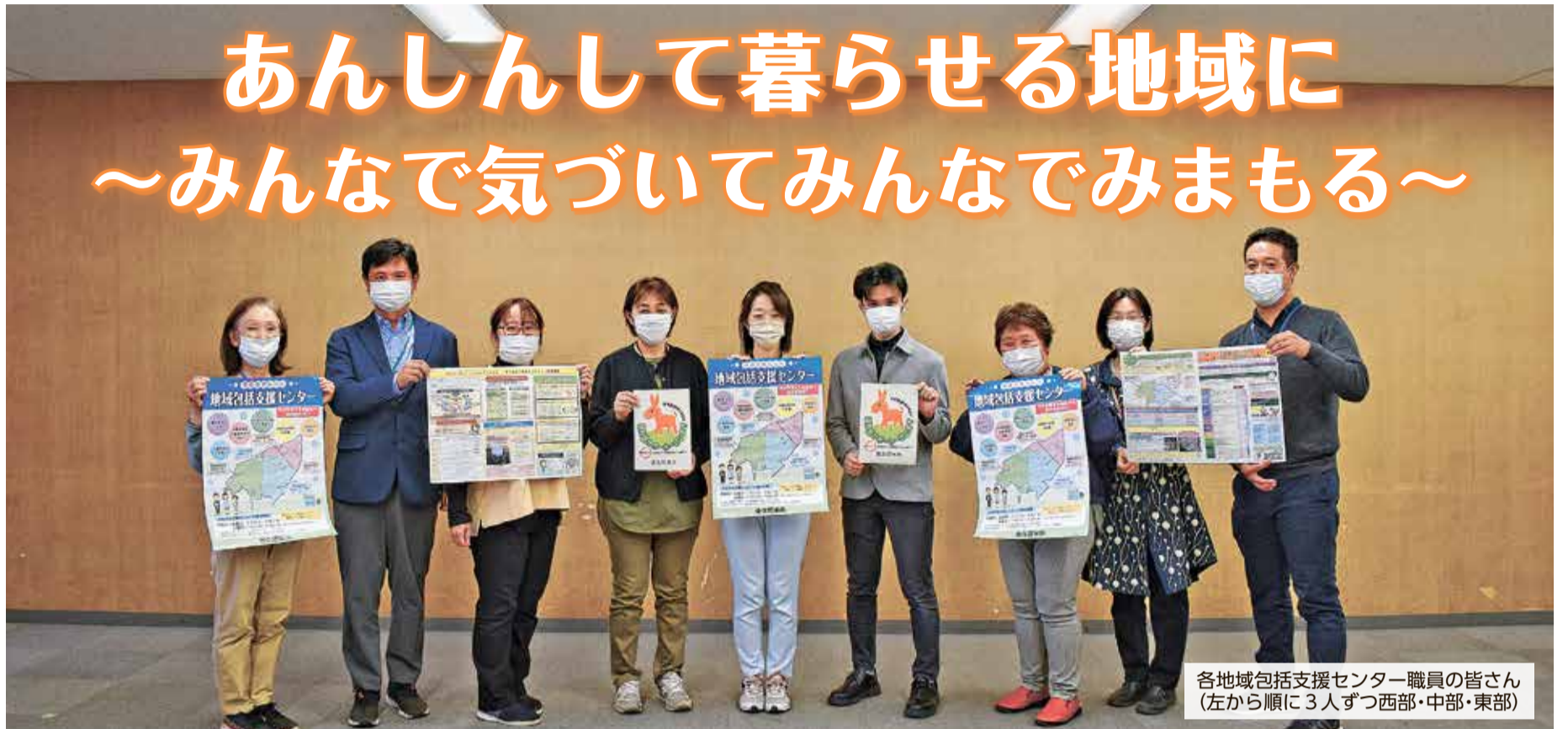
各地域包括支援センター職員の皆さん (左から順に3人ずつ西部・中部・東部)