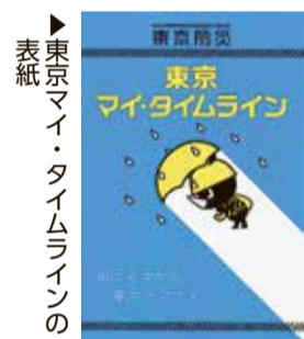
表紙 ▶東京マイ・タイムラインの