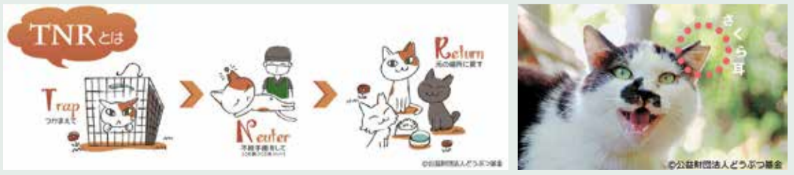
さくらねこTNRの解説