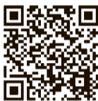
市庁 (防災関連情報)