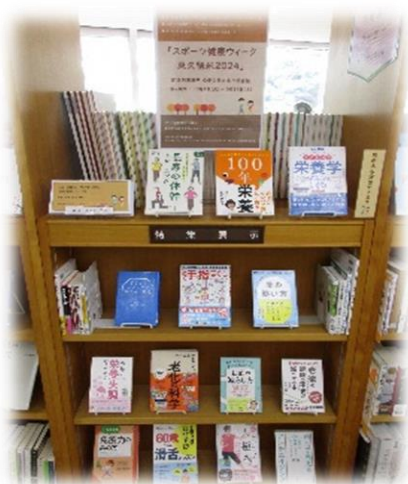
〈ひばりが丘図書館〉