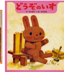
Eカ 『どうぞのいす』 香山美子/作 柿本幸造/絵 (ひさかたチャイルド)