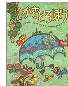
Eカ 『かさどろぼう』 シビル・ウェッタシン ハ/作 (徳間書店)