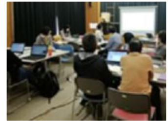
写真：編集作業、成果発表 「第3回ウィキペディアタウン in 東久留米」より