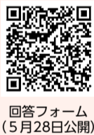
回答フォーム(5月28日公開)

回答方法 今年度、都などの連携事業で導入するデジタル掲示板でのオンライン受付を原則とします。なお、オンラインでの回答が困難な方向けに、市内各図書館(開館時間中)または企画調整課(市役所4階)で回答用紙の配布・受付を行います。回答内容は同掲示板で公開します