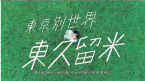
東久留米市プロモーション動画