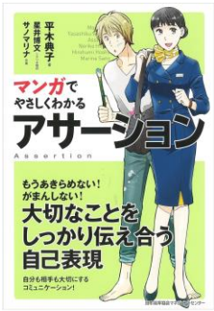
『マンガでやさしくわかるアサーション』 平木典子／著 日本能率協会マネジメントセンター 2015年