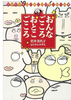
『おんなごころおとごころ』 岩井美代子／著 ワニブックス、2004年