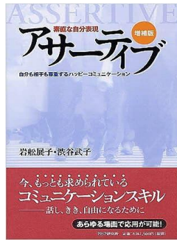
『素直な自分表現アサーティブ』 岩船展子・渋谷武子／著 PHPエディタース・グループ 2005年