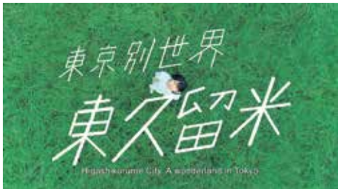
東久留米市プロモーション動画