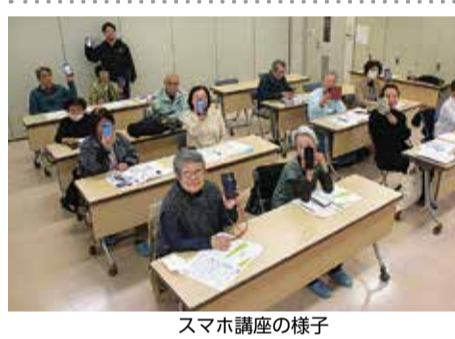
スマホ講座の様子