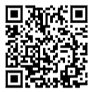
国税庁(確定申告書様式等)