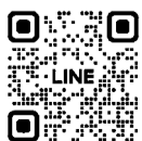
市LINE公式アカウント