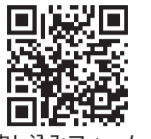
申し込みフォーム (対談)