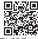
申し込みフォーム (もや虫を見つけよう!)

(定員5人、先着順)。2月24日(火)午後5時までに要申し込み☎2月16日(月)午前9時から、申し込みフォームまたは電話で同センターへ☎同センター☎042・472・0061