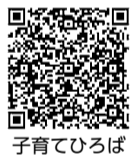
子育てひろば上の原☎