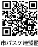
市バスケット連盟

の18歳以上の方(高校生不可)かつ5人以上で編成されたチーム1チーム5,000円(8年度新規登録で別途3,000円)市バスケットボール連盟詳しくは同連盟をご覧ください 同連盟 ☎(higashikurume.b.a@gmail.com)