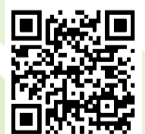
申し込み フォーム